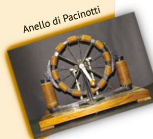
Anello di Pacinotti