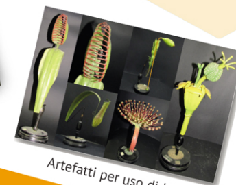
Artefatti per uso didattico